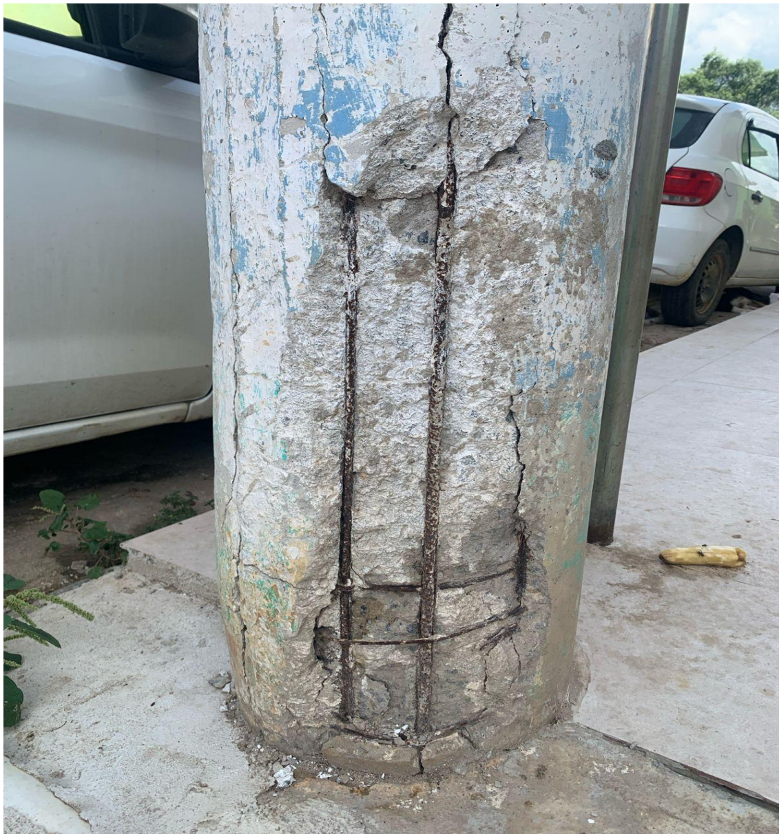
Figura 2 – Poste com armadura exposta e oxidada.

Constata-se poste de concreto armado apresentando exposição parcial da armadura metálica, sem visualização do núcleo interno da seção estrutural, porém com perda do cobrimento mínimo de concreto.